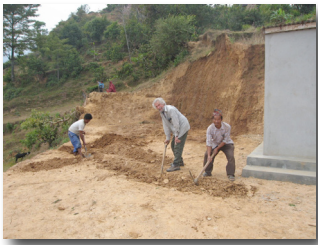
Creusant le drainage pour le Centre de service

Un drain a été installé autour du Centre pour évacuer l'eau qui s'accumulait pendant la saison des pluies. Cette eau a également causé un éboulis devant le Centre. Les villageois sont en train de le réparer.