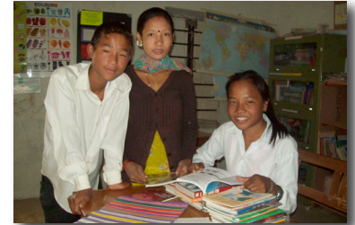
L'arrivée des nouveaux livres

Pour la quatrième fois en 5 ans, Recyc'Livres , un organisme à but non lucratif du Nouveau Brunswick, a financé l'achat de livres scolaires. Au total, 18 écoles de