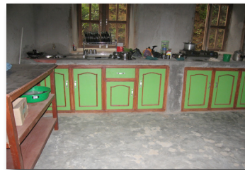
Les armoires de cuisine au Centre de service

Plusieurs des projets réalisés la dernière année tournent autour du Centre de service , construit de 2007 à 2009. Le Centre est constitué de huit locaux, dont deux sont occupés par le groupe de couture et deux par le Centre de santé communautaire . Un local sert de cuisine, un autre de bureau et deux locaux servent de salles de classe pour donner des formations.