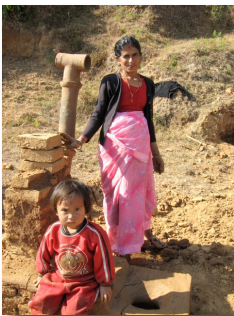
Fabrication des cheminées