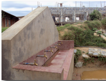
Bar à robinets

L' école Shree Bal Ujwal Lower Secondary School a bénéficié d'un nouveau réservoir de stockage d'eau avec une barre de robinets, ainsi que d'un système de captage d'eau de pluie, comprenant des gouttières et un réservoir souterrain pour récolter l'eau. Il reste maintenant à améliorer le système sanitaire de l'école pour terminer le projet.