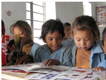
Les enfants du primaire regardant les nouveaux livres

Dans le cadre du projet « Renforcement des classes de maternelle et de première année » (16 écoles au total), deux écoles ont reçu 400$