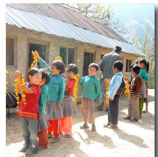
Cérémonie d'inauguration pour le nouveau toit de l'école