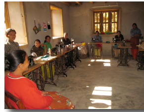
Cours de couture au Centre de service

Pour terminer, depuis l'automne 2010, nous offrons également dans le Centre de service des formations diverses à la population en général. Jusqu'à présent, des cours d'anglais ont été donnés, ainsi que des cours de couture, débutants et avancés. Des cours d'agriculture sur l'élevage caprin et bovin, les jardins familiaux et l'apiculture vont débiter sous peu. 🌸